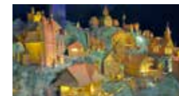
betlém v Horní Lidči

Informační centrum Horní Lideč 756 12 Horní Lideč 115 tel.: 737 701 047 (denně 8.00–15.00) e-mail: betlem@hornilidec.cz www.betlemhornilidec.cz