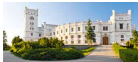
zámek Nový Světlou, Bojkovice

délka: 35 km povrch: lesní a polní cesty, silnice náročnost: vysoká start a cíl: Bojkovice (vlak, bus). Okružní trasa sleduje čtyři naučné stezky; na úseku Bojkovice k rozcestí Skalčiči NS Moravské Kopanice a z Žitkové až na rozcestí Pod Vyskovcem NS Okolo Hrozenka. Z rozcestí Pod Vyskovcem dojdete po červené turistické značce kolem lyžařského areálu Mikulčín vrch na rozcestí Troják. Odtud až do Bojkovic vás dovede zelená značka, k níž se v samém závěru připojuje NS Koménka s možnou odbočkou do obce Komňa. Náročná trasa, stoupání 1000 m.