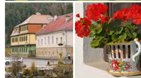
Smraďavka tupeska keramika