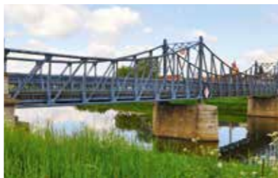
most v Kostelanech nad Moravou

Městské informační centrum Na Rynku 886 686 04 Kunovice tel.: 572 549 999 e-mail: mic@mesto-kunovice.cz www.mesto-kunovice.cz