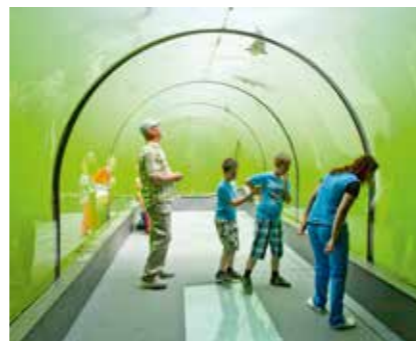
Živá voda v Modré

Informační centrum Velehradský dům sv. Cyrila a Metoděje U Lipy 302, 687 06 Velehrad tel.: 571 110 538 e-mail: info@velehradinfo.cz www.velehradinfo.cz