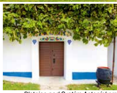
Blatnice pod Svatým Antonínkem

Informační centrum Uherský Ostroh Zámecká 24, 687 24 Uherský Ostroh tel.: 572 503 960 e-mail: infocentrum@uhostroh.cz www.uhostroh.cz