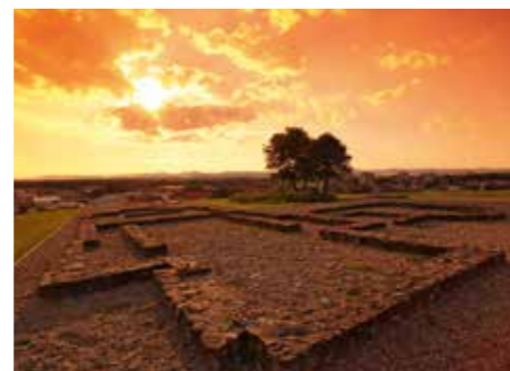
Výšina sv. Metoděje v Uherském Hradišti

Městské informační centrum Na Rynku 886 686 04 Kunovice tel.: 572 549 999 e-mail: mic@mesto-kunovice.cz www.mesto-kunovice.cz