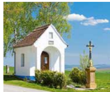
kaplička ve Vičnově