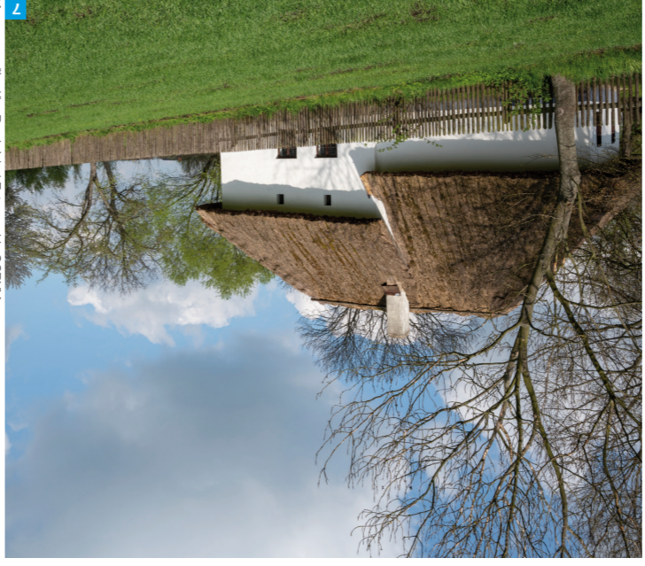
4 Muzeum v přírodě v Rymnicích