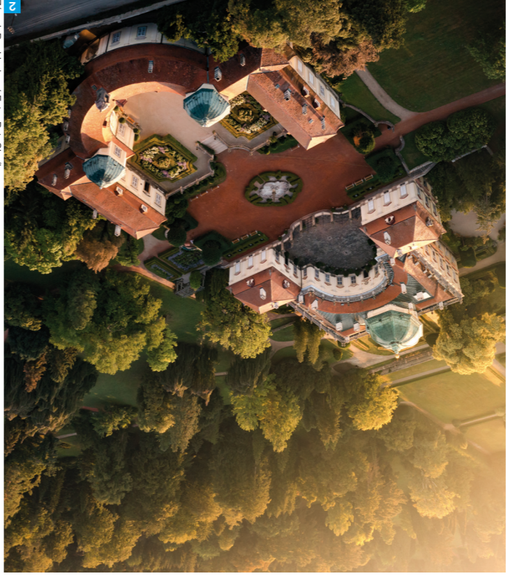
2 Zámek Buchlovice

Chcete-li vidět kus Východní Moravy z výšky a současně si prohlédnout zcela zachovalý středověký hrad, navštivte Buchlov. Romantické duše rozněží barokní zámek Buchlovice s nádherným parkem, v němž zpívají pávi a kde zapomenete na starosti všedního dne.