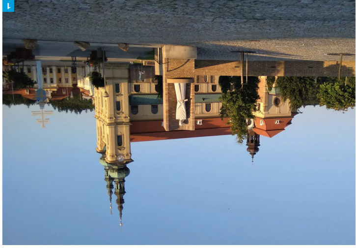
1 Velehrad / Foto: Hamboaticz