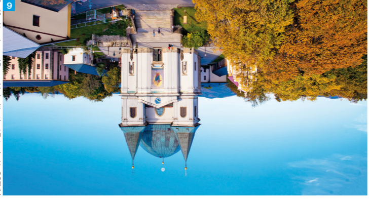
3 Bazilika Nanebevzetí Panny Marie, Hostýn