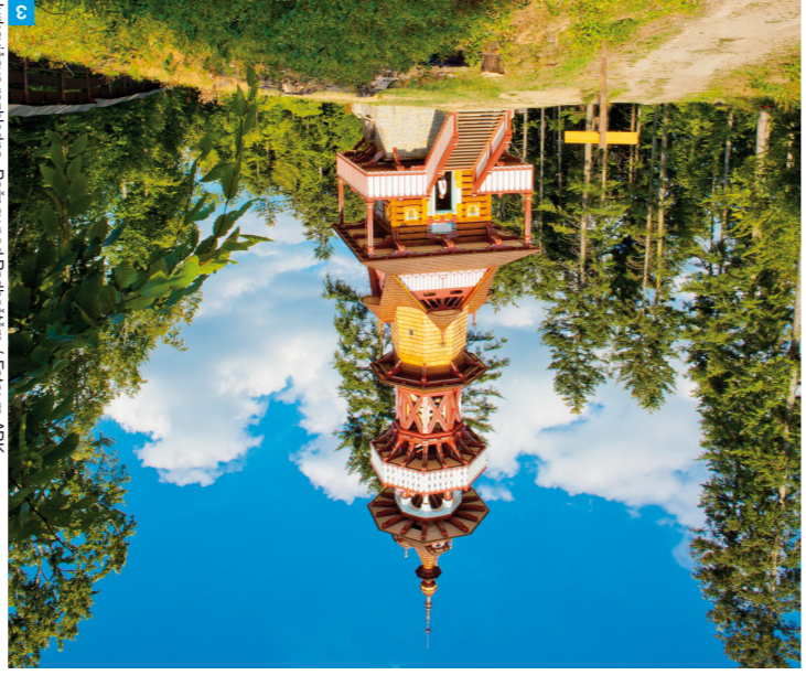
3 Jurkovičova rozhledna, Rožnov pod Radhoštěm

Ne za kulturu, ale rovnou za umělecká díla, lze považovat valašské dobroty: trgal, kyselica, halušky či kontrabás.