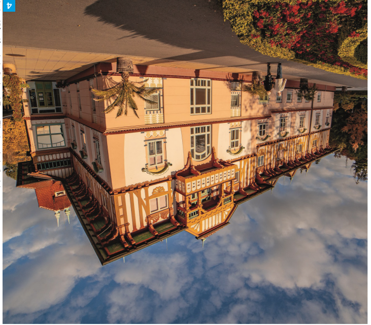
4 Jurkovičov dům, Luhačovice

Mystickým místem jsou Kopanice, zejména obec Zlítková proslavená literárními díly o místních ženách nadaných nadpřirozenými schopnostmi, ale především nádhernou a nespoutanou přírodou Bílých Karpat.