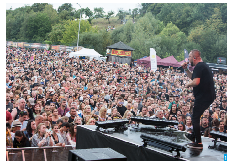
12 Vizovické trnkobraní

Vizovické trnkobraní , legendární multizánrový festival v areálu světově proslulého výrobce ovocných destilátů, pravidelně v druhé polovině srpna. (Doporučujeme návštěvu zámku ve Vizovicích s cennými exponáty empiru a biedermeieru.)