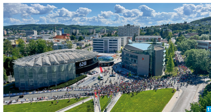
11 Zlín Film Festival

Otevírání pramenů v lázních Luhačovic , pravidelně o prvním víkendu v květnu. (V Luhačovicích doporučujeme: architektura Dušana Jurkoviče, kolonádu s halou Vincentka, Muzeum Luhačovickeho Zálesí aj.)