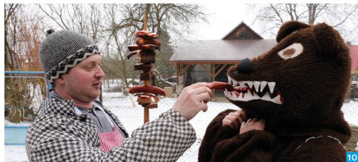
10 Fašank, Muzeum Regionu Valašsko

Fašanky čili masopustní veselice se obvykle konají o víkendech, které předchází tzv. Popeleční středě, již v prostředí církve začíná předvelikonoční postní období. Stejně jako Velikonoce je Popeleční středa pohyblivý svátek a vypočítává se podle prvního jarního úplňku.