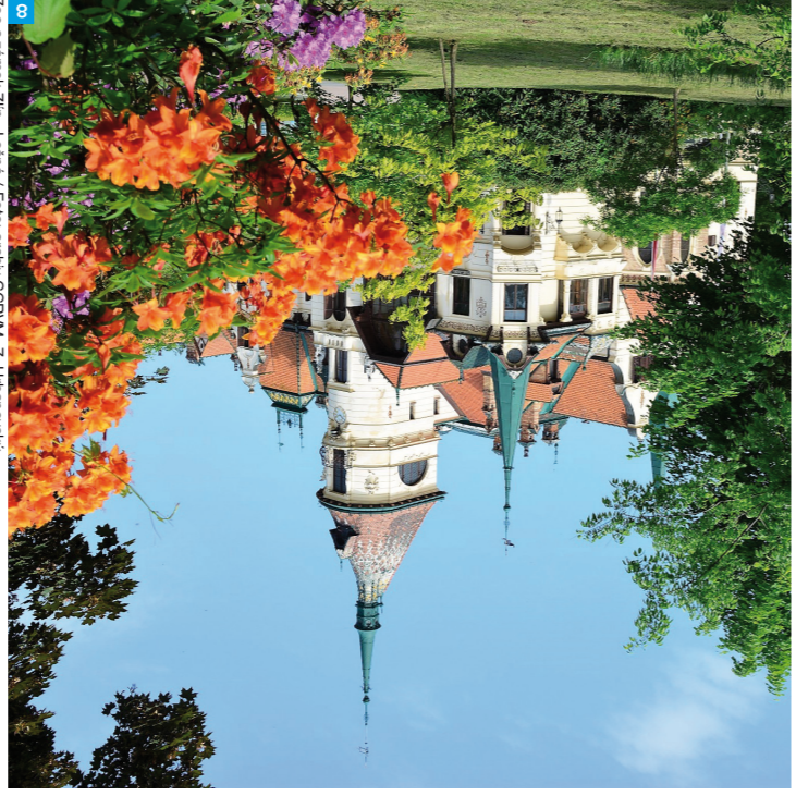
8 Zoo a zámek Zlín - Lesná

Navštivte batovskou expozici v Muzeu jihovýchodní Moravy! Z Batova mrakodrapu se rozhlédnete desítky kilometrů na západ i východ.