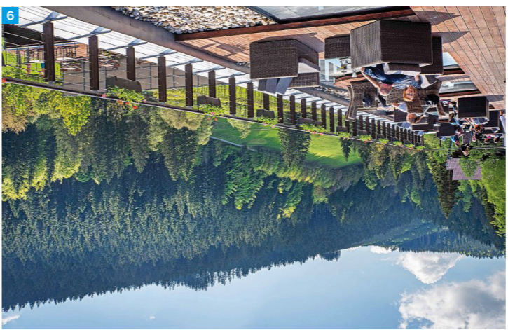
9 Hotel Hotel, Resort Valačchy

Špičkové služby nabízejí například Velké Karlovice a v nich Resort Valačchy s pestrou nabídkou hotelů. Vyhledávány je též nedaleko se rozprostírající Resort Kyčinka s Grandhotelem Tatra či dřevěnými chalupkami, a též horské hotely Solán či Kohútka, ale i mnoho dalších.