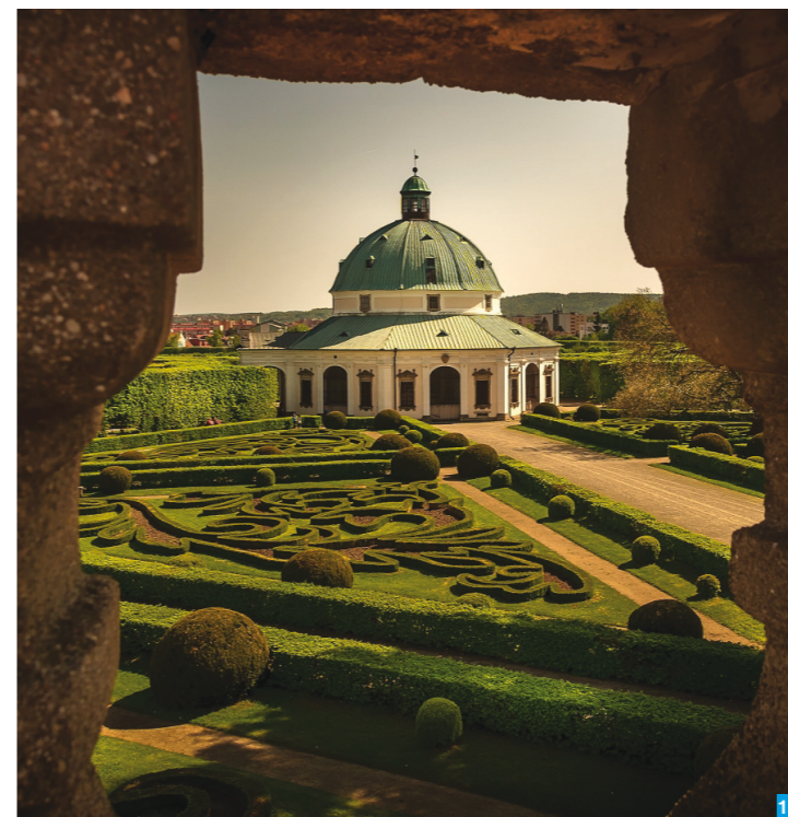
Kroměříž Květná zahrada / Foto: M. Peterka

Vydejte se odtud aktivně relaxovat, anebo i rozjimat do Hostýnských vrchů. Svátý Hostýn se slavnou bazilikou se nazývá „Majákem Moravy“ a rozhodně se tím vedle orientačního bodu myslí i duchovní bájná síla místa známá široko daleko.