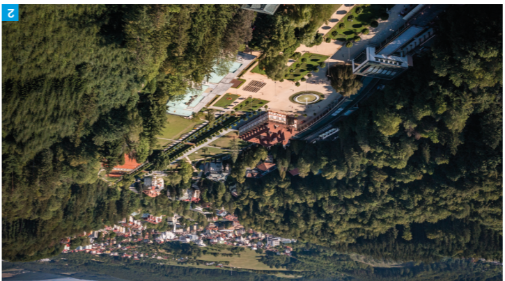
2 Luháčovice / Foto: P. Slawik

Uživte si doteky – klasické i exotické masáže nebo beauty rituály, které povzbudí vaše tělo i ducha, koupel v termálních bazénech, pivní a mořské koupele i saunové ceremoniály. Kochejte se krásou okolní přírody, ale třeba i hvězdného nebe ve venkovním whirlpoolu. Vychutnejte si to nejlepší z regionální kuchyně připravené z kvalitních surovin v tradičním i moderním pojetí.