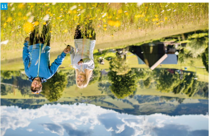
11 Velká Lhota