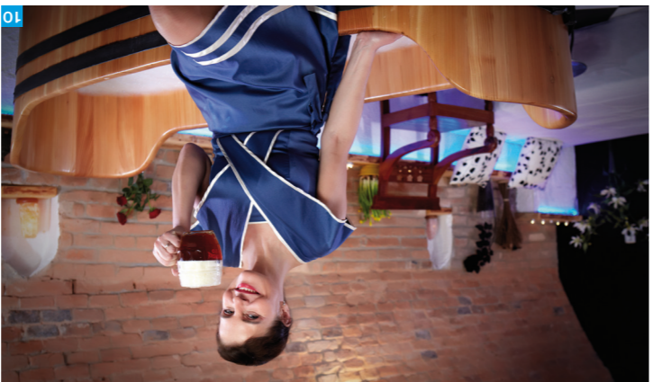
10 Pivní lázně, Rožnov pod Radhoštěm

Se skvělymi ubytovacími zařízeními s wellness službami se setkáte v celém údolí Rožnovské Bečvy. Příkladem může být třeba Endemii Boutique Hotel v Horní Bečvě. Sve nadsené fanoušky mají Rožnovské pivní lázně, pracovně! turistě nedají dopustit na Vsacky Cab na hřebeni Vsetínských Beskyd.