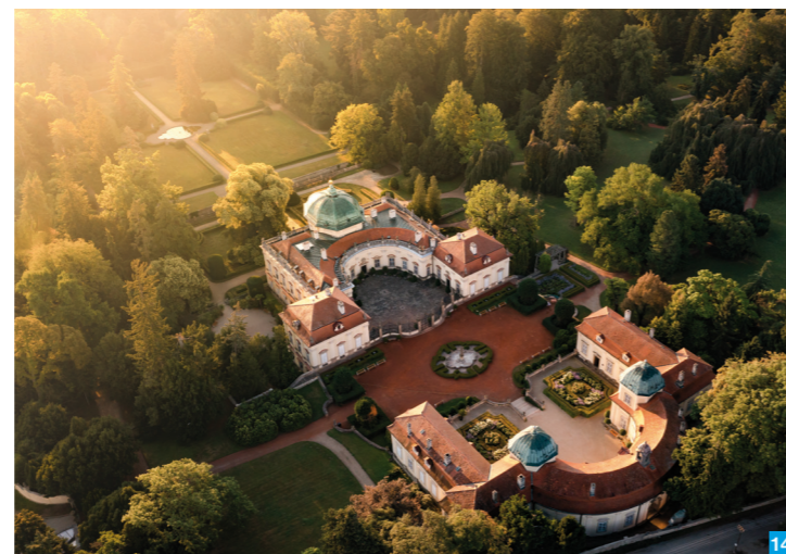
Zámek Buchlovice / Foto: P. Slavík

Užijte si relaxaci v jednom z lesních resortů v hájemství čisté přírody Chřibů. Toulání smíšenými lesy, v nichž na vás čekají skály, skalky, dokonce skalní města zharmonizuje vaši duši. Kdo má rád pohled z výšky, poletí balonem a nechá se okouzlit tichem a krásou krajiny nebo siluetou nikdy nedobytného hradu Buchlova.