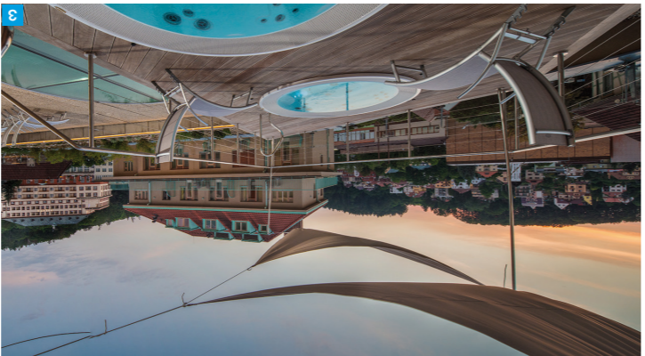
3 Wellness hotel Alexandra, Luháčovice

Své o mimorádnosti Luháčovic věděl hudební skladatel Leoš Janáček, který zde trávil letní čas, odpočíval i komponoval. Připomíná ho tradicí festivalu Janáček a Luháčovice. Také kolonádní koncerty i divadla v kulisách lázeňského města se vám budou určitě líbit.