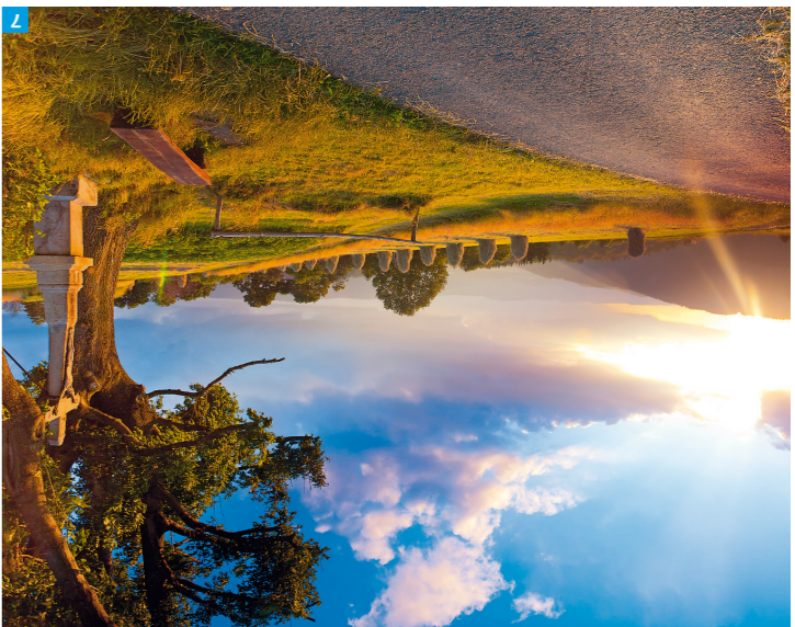
7 Saň, Vseňské Beskydy