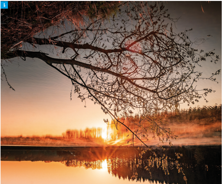
1 Písnáň Fryšák

Stáčí si vybrat některou z našich krásných lokací: Beskydy a Javorníky, Bílé Karpaty, Chřiby nebo Hostýnské vrchy. Nabídka Východní Moravy je pestra.