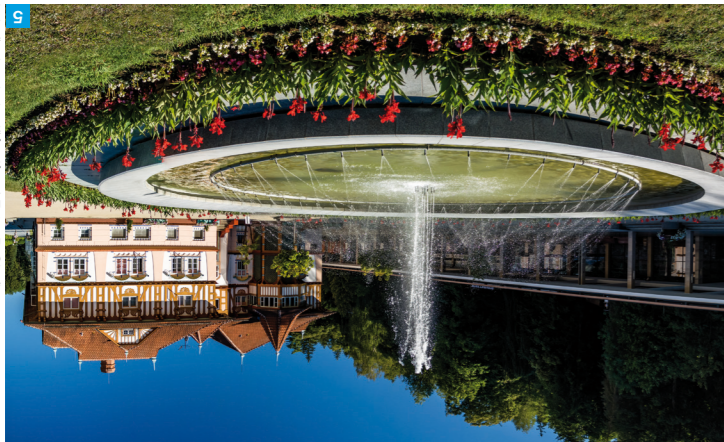
5 Luháčovice Jurkovičův dům

Prozkoumejte genius loci Luháčovic s průvodcem Luháčovice: tady pramení architektura, který najdete v mistním informačním centru, nebo se projděte s audio průvodcem Zvuková mapa Luháčovic. Jde o nádherné zpracované rozhlasové hry. Jsou málymi dramaty i veselými historkami, se kterými poznáte lázně zase trochu jinak. Unikátní zážitkí!