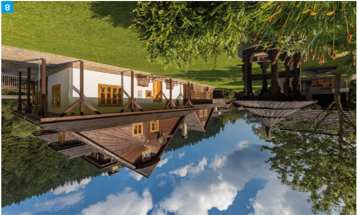
8 Chalupa u Kopeckých Velké Karlovice

V Luháčovcích prožijete romantiku na lázeňské kolonádě, v okolí Luháčovické přehrady v nedalekých Pozlovicích si vyberete z řady aktivit - nabízejí se procházky, in-line bruslení, jízdá na kole, projíždky na lodíčkách či šlapadlech. Objevte elegantní pivorepublikovou eleganci i nápadiť stavby architektky Dušana Jurkoviče. Relaxovat můžete na všechny způsoby, dokonce i v jurtě.