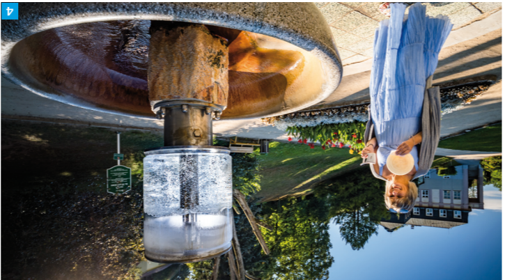
4 Luháčovice, Pramen Dr. Sastneho

Pro malou vzdálenost se z Luháčovic nabízí také Luháčovické Zálesí a Bílé Karpaty, které jsou doslova nadohled. V nich zapomenete na čas i prostor.