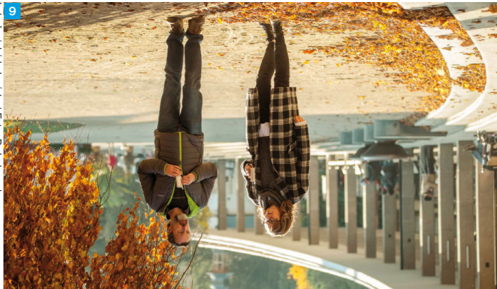
6 Luháčovická kolonáda

Prozkoumejte genius loci Luháčovic s průvodcem Luháčovice: tady pramení architektura, který najdete v mistním informačním centru, nebo se projděte s audio průvodcem Zvuková mapa Luháčovic. Jde o nádherné zpracované rozhlasové hry. Jsou málymi dramaty i veselými historkami, se kterými poznáte lázně zase trochu jinak. Unikátní zážitkí!