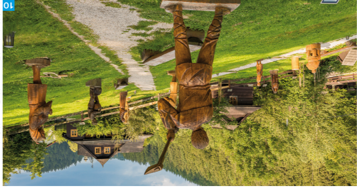
Velké Karlovic

Centrem jižního Valašska jsou Valašské Kloubouky. Tradice se zde dodržují celoročně, nejznámější je ovšem Valašský mlkulašský jarmek s legendárními čerty. Ti kvůli prastarým strašidelným maskám a hmození řetězy a zvonce nenechají v klidu či jistě ani dospělé návštěvníky. V srpnu zase ozívají Valašské Kloubouky Setkaníu Bilých Karpát. Součástí je gastrofestival, na němž poznáte veškeré zdejší speciality.