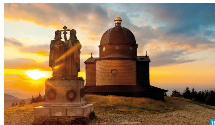
16 Radhošť / Foto: m-ARX

Život obyvatel Velké Moravy, jejich zvyky a řemesla, působivě přibližuje Archeoskanzen Modrá, nadhled od Velehradu.