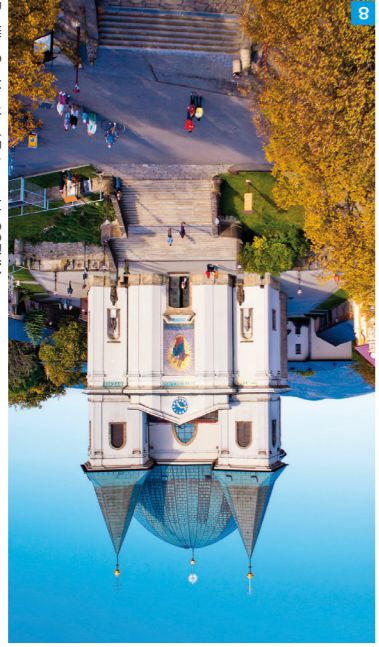
Bazilika Sv. Hostýn

V Bystřici pod Hostýnem můžete vidět expozici ohybaného nábytku, který udělal díru do světa a podmanil si Vídeň, Paříž i New York. Možná je i exkurze do výroby.