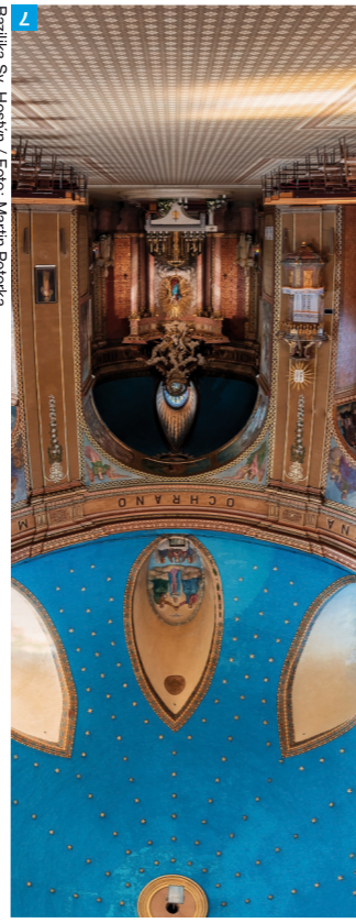
Bazilika Sv. Hostýn / Foto: Martin Peterka

Určité náhledně do Muzea lidové tvorby a tradic Vlachovska, jehož součástí je turistická naučná stezka po 8 historických dřevěných vlachovických susímách ovoce. V České republice se jedná o jedinou stezku tohoto druhu - Vlachovice se totiž pyšní největším množstvím funkčních starých susíren ovoce.