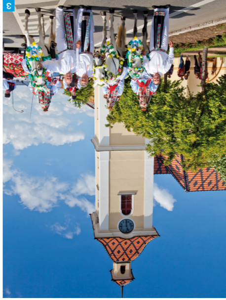
Jízda kráľu, Kunovice

V místním Muzeu v přírodě Rochus naleznete skanzen lidových staveb. Zajímavé expozice nabízí Slováckém muzeu, Evropský významnou legendárních vdolečkách, je i galerie s obrazy Joži Uprky ze žvota Moravských Slováků.