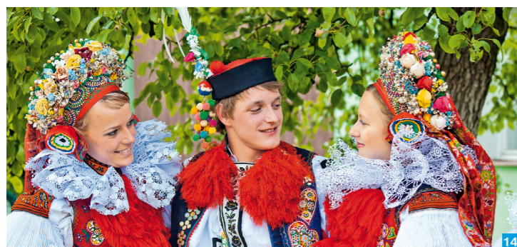
14 Vlčnov

Zažijte region, kde lidové slavnosti, hody, festivaly, podzimní žehnání mladého vína a další události jsou jinde nevídanou přehlídkou lidových krojů, písní i tanců. Vítejte u nás!