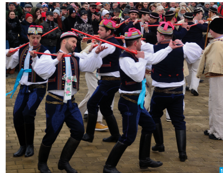
17 Fašank Strání

Krásu hor objevíte na vrchu Lopeníku, ryzi a autentický folklór třeba i ve Strání. Zdejší fašank, neboli masopust, je nezapomenutelným zážitkem. Stále živá je tu i staletí trvající tradice sklářství. Doslova nadhled je Velká Javorina, dominantna pohoria a místo slavných setkání moravských a slovenských přátel.