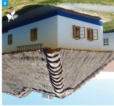
Muzeum v přírodě - Park Rochus, Uherské Hradiště / Foto: archív CCRVM

Na Slovácku se také zachovala řada tradičních řemesel – např. hmočírství, košíkářství nebo malování kraslic.