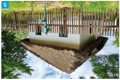
Muzeum v přírodě Rymice