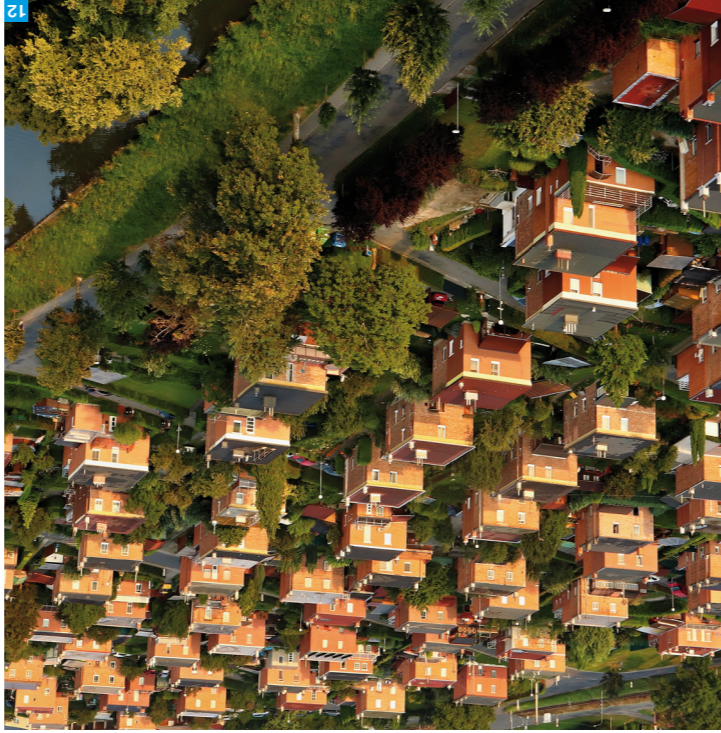
Bátovské duniky, Zlín-Podvesná

Ještě před sto dvaceti lety byl Zlín nevyznaným provinčním městečkem. Po Batoově podnikatelském zázraku se však stává ve 20. a zejména 30. letech 20. století hlavním světovým městem obuvi.