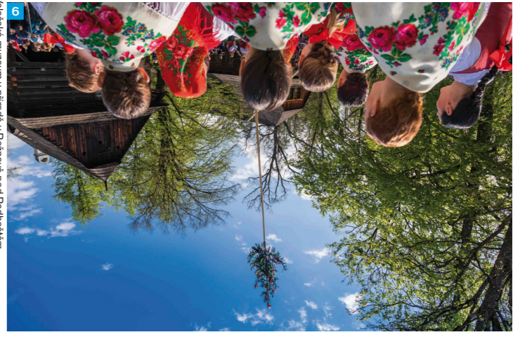
Valašské muzeum v přírodě v Roznově pod Radhoštěm

K místní tradiční gastronomii patří povídky či tvarohový frgál, kyselica, halušky nebo kontrabás.