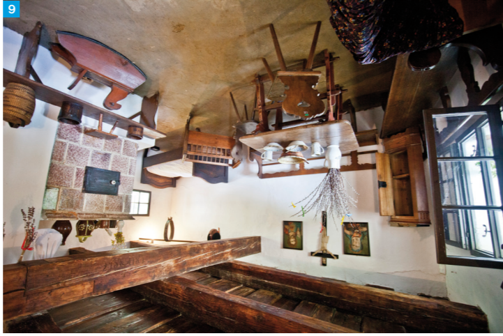
Muzeum v přírodě Rymice

Centrem jižovýchodní Haně je Kroměříž, město, jež si před staletími vybrali za své letní sídlo olomoučtí arcibiskupové. Arcibiskupský zámek a zahrady - Kvěná a Podzámeká, jsou památkou UNESCO.