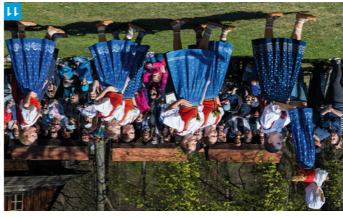
Valašské muzeum v přírodě v Roznově pod Radhoštěm

V nedaleké Horní Lúdi, železniční křižovate, je k vidění evropsky unikát patiči k vrcholům tradice vyřezávaných betlémů. Neváhejte a v jakoukoliv roční dobu navštivte