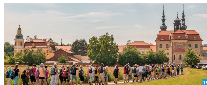
15 Pouť Velehrad