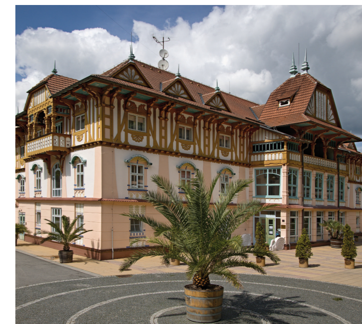
18 Jurkovičův dům, Luhačovice