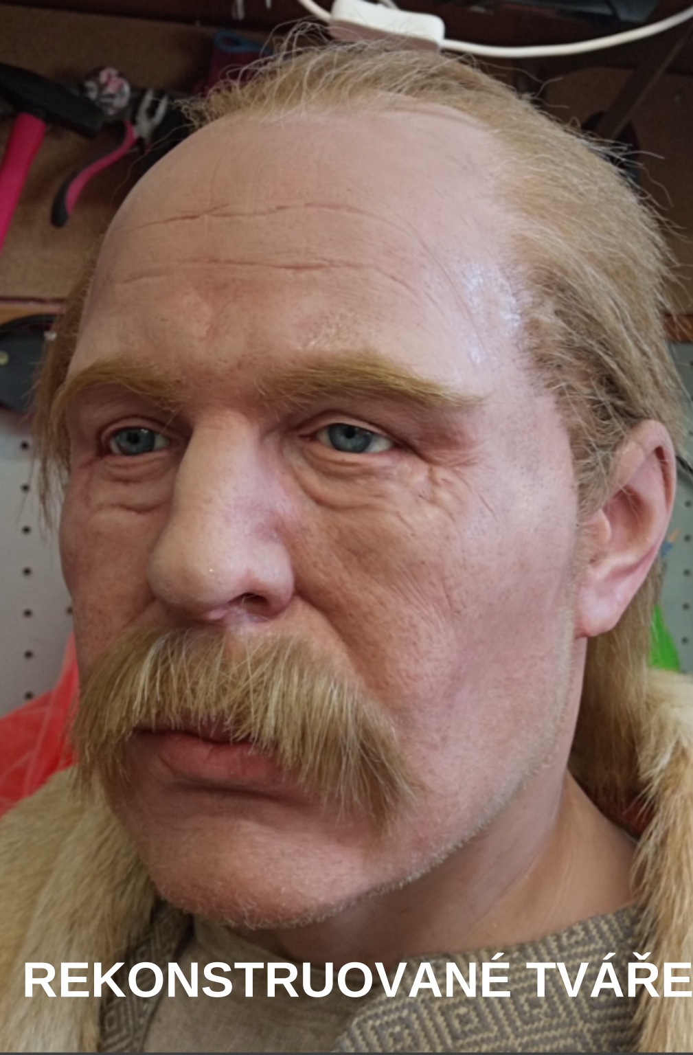
REKONSTRUOVANÉ TVÁŘE LIDÍ